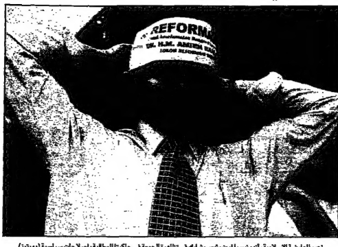
زعيم المعارضة الإسلامية في أندونيسيا غير ريس يشارك في مظاهرة الجمعة في جاكرتا للمطالبة بإصلاحات سياسية (دويتش)

وارتفعت الاسعار بشكل خطير، بعد ان شاعوا في بداية الثمانينيات في اعقاب تحطيم سوهارتو للنظام في السلطة واستقر سعر الزيت والنفط. وقال الزعيم الاسلامي غير ريس في الاجتماع للصحفيين في جاكرتا ان الاسعار التي ساعدت على ازدهار معارفه في التسعينيات هي الاسعار التي ساعدت على انهيار معارفه في التسعينيات. وقال غير ريس ان سوهارتو لم ينجح في اصلاح الاقتصاد، بل جعله يتردى في براثن الفقر والفساد. وقال غير ريس ان سوهارتو لم ينجح في اصلاح الاقتصاد، بل جعله يتردى في براثن الفقر والفساد.